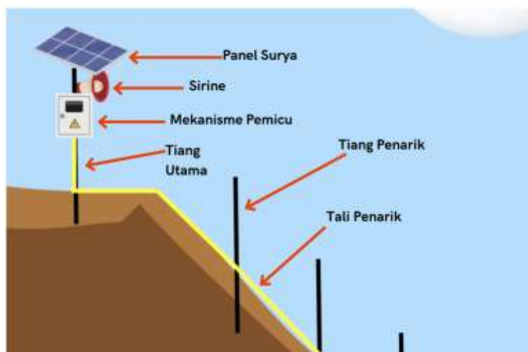
Gambar 3. Ilustrasi sistem kerja EWS

Tahapan ini merupakan proses yang paling memakan waktu untuk dilaksanakan karena pembuatan sistem skala lapangan membutuhkan ketelitian dan perhitungan yang matang. Selain itu, bantuan dari pihak lain juga sangat diperlukan untuk membuat sistem yang dapat bekerja dengan baik seperti halnya diperlihatkan pada Gambar 4. dengan melibatkan tukang las lokal untuk membantu pembuatan rangka box EWS-nya.