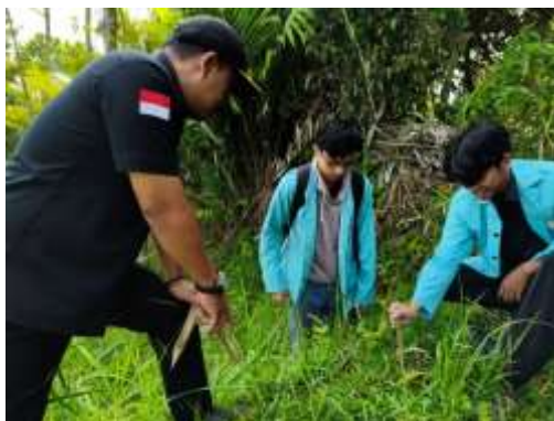
Gambar 7. Tim KKN bersama relawan melakukan survei lokasi potensial untuk EWS

deteksi dini serta membangun partisipasi masyarakat melalui gotong royong dalam perakitan, pemasangan, dan perawatannya. Dengan demikian, keberadaan alat ini diharapkan mampu menekan risiko korban jiwa maupun kerugian material saat terjadi longsor. Gambaran dari kegiatan ini dapat diilustrasikan pada Gambar 7.