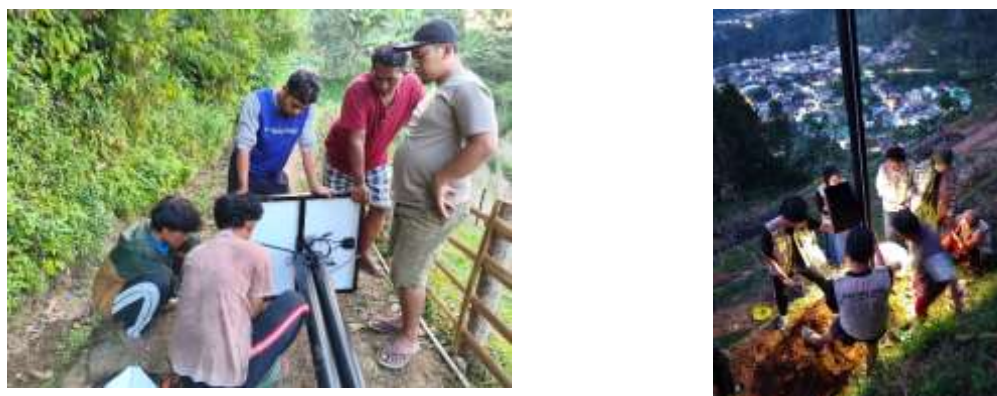
Gambar 5. Proses pemasangan EWS oleh tim KKN bersama warga

riwayat kejadian tanah longsor yang berulang kali terjadi. Proses pemasangan dapat dilihat pada Gambar 5.