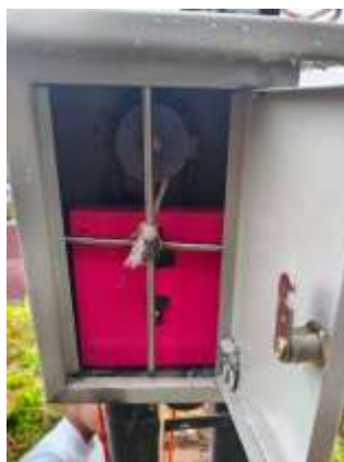
Gambar 2. Wadah sistem kelistrikan EWS

Sedangkan dari bagian kelistrikan, sistem ini dilengkapi dengan sebuah wadah berisi 4 buah saklar dengan fungsi masing-masing. 2 saklar pertama memiliki fungsi peran untuk mengaktifkan sirine, sedangkan 2 saklar terakhir akan bertugas menaikkan voltase yang mengakibatkan raungan sirine menjadi lebih keras dan memperluas wilayah peringatan yang dijangkau. Bagian kelistrikan sistem dapat diperlihatkan pada Gambar 2.