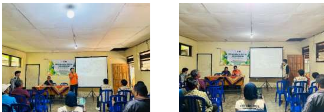
Gambar 6. Proses sosialisasi oleh tim KKN bersama BPBD Karanganyar kepada warga Desa Ngledoksari

Terakhir adalah proses simulasi dan sosialisasi terhadap warga desa Ngledoksari dengan narasumber dari tim KKN UNS 81 serta BPBD Karanganyar. Sosialisasi ini merupakan bagian yang sangat vital karena informasi yang disampaikan berkaitan dengan bagaimana maintenance alat serta pentingnya kesadaran warga sekitar agar lebih peka dalam membaca keadaan alam disekitar tempat tinggalnya. Tahapan sosialisasi pada kegiatan ini dapat dilihat pada Gambar 6.