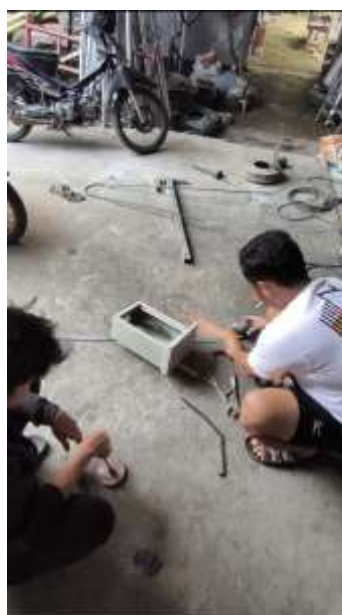
Gambar 4. Pembuatan kerangka EWS

Tahapan ini merupakan proses yang paling memakan waktu untuk dilaksanakan karena pembuatan sistem skala lapangan membutuhkan ketelitian dan perhitungan yang matang. Selain itu, bantuan dari pihak lain juga sangat diperlukan untuk membuat sistem yang dapat bekerja dengan baik seperti halnya diperlihatkan pada Gambar 4. dengan melibatkan tukang las lokal untuk membantu pembuatan rangka box EWS-nya.